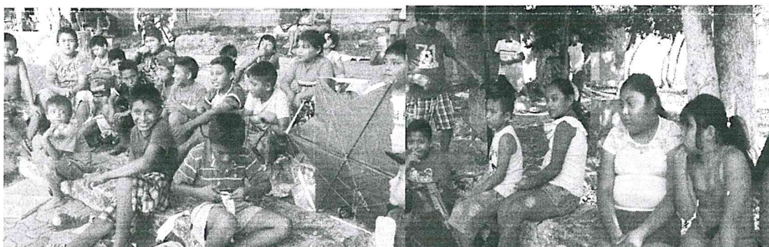
Taller y tomo de papabtes realizado por la cooperativa AK-VENTURES para los niños de la comunidad de Akumal.

D) para la conservación del permiso, se hagan aportaciones, donaciones o cualquier tipo de apoyo constante hacia la comunidad tal y como esta cooperativa lo ha realizado en el transcurso de su trabajo, así como se demuestra en las fotografías de las diferentes actividades que se han realizado.